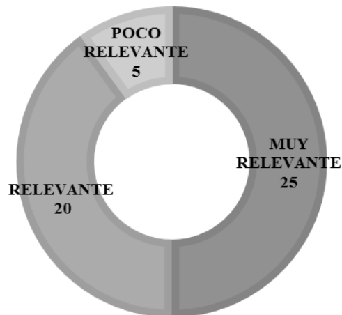
Figura 2 Distribución de los expertos según su categoría.