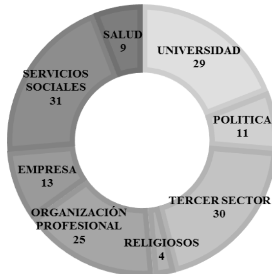
Figura 3 Distribución de los expertos por grupo profesional 4 .

Se han realizado cincuenta entrevistas profundas a expertos de España. Los expertos se agrupan en los siguientes grupos 3 : universidad, política, Tercer Sector, organizaciones profesionales, empresa y sector Servicios Sociales y sanidad. El 90% tiene una categoría de nivel de experto de relevante y muy relevante y la muestra cuenta con una media de 28 años de experiencia con el Trabajo Social (desviación típica de 13 y mediana de 26 años de experiencia). (V. anexo 2).