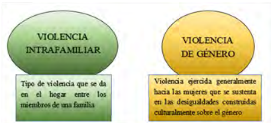
Gráfico 1. Diferencia entre violencia intrafamiliar y violencia de género

niveles de sujeción en los que la víctima se desprende de cualquier poder. b) Control sobre la privacidad. c) Presión sobre el entorno de la víctima, haciendo referencia a los esfuerzos que hace el agresor por alejar a la víctima de sus redes familiares, de amistad, etc. d) Denigración, entendida como todo acto que genera el agresor donde oprime de forma verbal, psicológica y física, a través de frases hirientes que llevan a la víctima a un estado de humillación incapaz de defenderse.