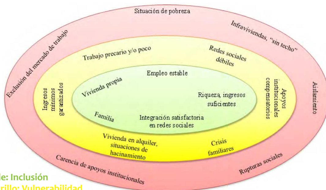
Gráfico 1. Itinerario hacia la Exclusión Social