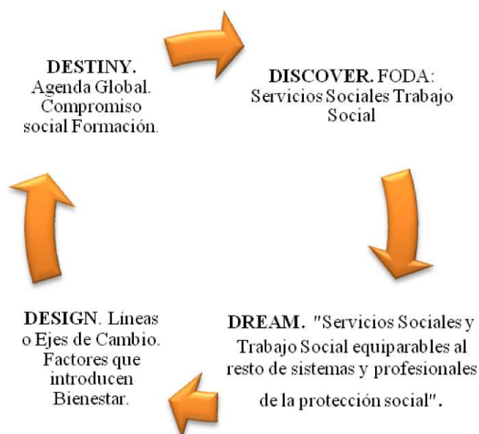
Gráfico 4: Ciclo 4D del Enfoque Appreciativo aplicado al Trabajo Social y a los Servicios Sociales.

Una vez identificados los puntos fuertes de los Servicios Sociales y del Trabajo Sociales, hemos de clarificar cuáles son los factores que introducen Bienestar y Malestar en los mismos. Aplicamos el Enfoque Appreciativo y presentamos las siguientes propuestas de transformación :