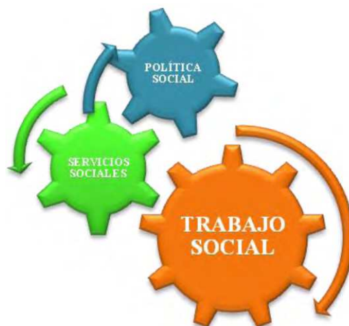
Gráfico 2: Relación entre el Trabajo Social, los Servicios Sociales y la Política Social como generadores de Bienestar .

Queremos conectar estos tres conceptos. No se entienden de manera separada. Han de estar en interconexión y armonía. Han de funcionar como un engranaje generador de BIENESTAR SOCIAL para la ciudadanía.