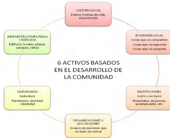
Figura 1: Mapa de activos en salud